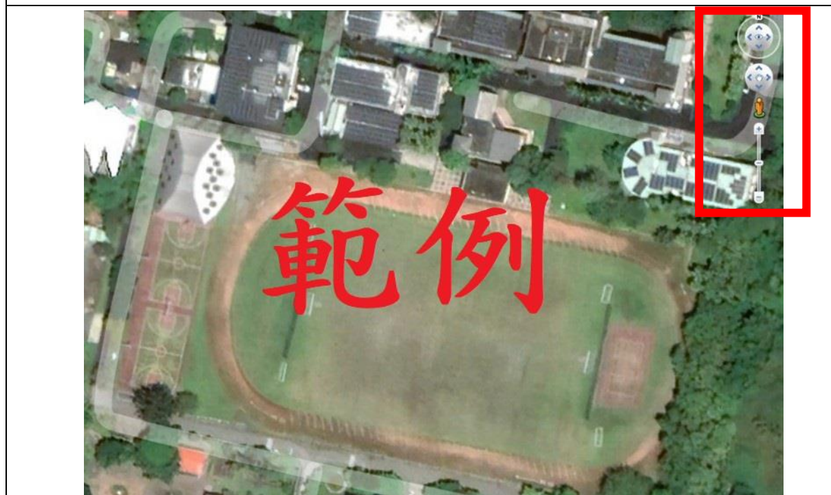
圖 2、空拍圖（請使用 Google Earth Pro，並於右上角附上球場座向標示）